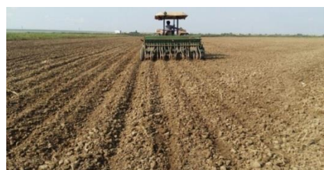
شکل ۴- خطی کار غلات (بذرکار همدانی) برای کاشت مرسوم گندم

محتوای انرژی برای منابع مختلف ورودی سامانه شامل نیروی کارگری، ماشین‌های کشاورزی، سوخت دیزل، سموم شیمیایی، کودهای شیمیایی و بذر در نظر گرفته شدند. خروجی‌های سامانه شامل گندم و کاه هستند. هم‌ارزهای انرژی که برای محاسبه‌ی انرژی هر