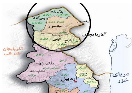
شکل ۱- موقعیت جغرافیایی دشت مغان و پارس آباد

دشت مغان سرزمین گسترده و دشت پهناوری است که از رسوبات رودخانه ارس تشکیل شده و مساحت تقریبی آن ۳۰۰ تا ۳۵۰ هزار هکتار است. دشت مغان از سه شهر گرمی، بیله سوار و پارس آباد تشکیل شده است و در شمال استان اردبیل قرار دارد (شکل ۱). در میان شهرهای مغان، در شمالی‌ترین نقطه، پارس آباد به دلیل رونق کشاورزی، گوی سبقت را از دو شهر دیگر ربوده است. با تأسیس شرکت کشت و صنعت و دامپروری مغان در سال ۱۳۵۳ در سطح ۶۳ هزار هکتار، این دشت به یکی از قطب‌های کشاورزی، دامپروری و صنعتی کشور تبدیل شد.