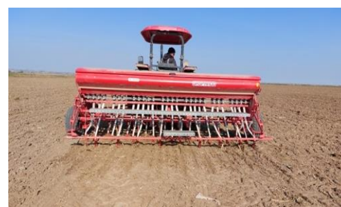
شکل ۳- کاشت گندم با خطی کار فاقد جوی‌ویشته‌ساز (گاسپاردو)