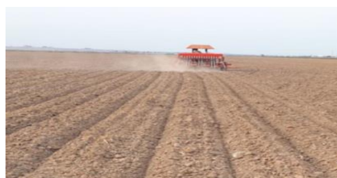
شکل ۲- کاشت گندم روی پیشته‌های بلند با خطی کار رایزید

هر کرت آزمایشی، برای هر کدام از بذرها، زمان کاشت با زمان سنج اندازه‌گیری شد. روش آبیاری مورد استفاده، جوی‌ویشته‌ای بوده و مقدار آب مصرفی کاربردی در محصول گندم با استفاده از ابزار اندازه‌گیری پارشال فلوم ۱ ، محاسبه شد. با نصب این ابزار در ورودی و خروجی مزرعه، دبی عبوری هر دوره برآورد می‌شود. داده‌های جمع‌آوری شده با استفاده از نرم‌افزار IBM Statistics 27 و SPSS تجزیه و تحلیل شده و میانگین برخی شاخص‌ها با استفاده از آزمون دانکن ۲ با هم مقایسه شدند.